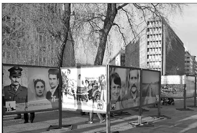
Fragment wystawy w Oslo

zrywie nie uczestniczyli, da żywy przykład, jak wielkie idee przekuć w codzienną rzeczywistość.