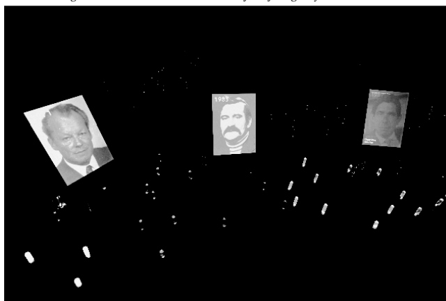
Ogród Noblistów w Centrum Pokojowej Nagrody Nobla w Oslo

Wszyscy, którzy pojawili się na uroczystym otwarciu wystawy w Oslo, zostali zaproszeni do zwiedzenia Centrum Pokojowej Nagrody Nobla. Nie jest to pod żadnym względem tradycyjne muzeum. Utworzono je w zabytkowym budynku, w miejscu starej